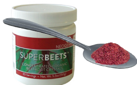
1 teskeið SUPERBEETS