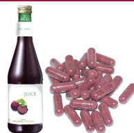
1 flaska af safu 500 ml eða 25 rauðrófuhylki

Nitric Oxide náttúruleg kynörvun fyrir karla og konur